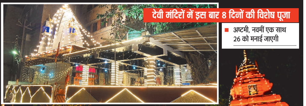
■ अष्टमी, नवमी एक साथ 26 को मनाई जाएगी