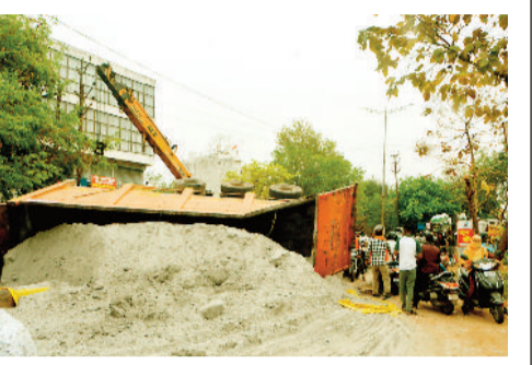
बिलासपुर। ब्रेक फेल होने से अनियंत्रित होकर राखड़ से भरा ट्रैलर सड़क पर पलट गया। सुबह सड़क पर भीड़ नहीं होने से बड़ा हादसा टल गया है। सरकण्डा पुलिस के अनुसार, बुधवार की सुबह 5 बजे होटल डाउन टाउन के पास राखड़ से भरा ट्रैलर कर्माक सीसजी 04 पीजी, 7502 का ब्रेक फेल होने से अनियंत्रित होकर पलट गया। सड़क पर राखड़ फैल जाने से आवागमन बाधित हो गया था। सुबह ट्रैफिक कम होने से बड़ा हादसा होने से टल गया। सूचना मिलते ही पुलिस मौके पर पहुंच गई। जेसीबी की मदद से सड़क में फेले राखड़ को हटाया गया। वहीं केन से ट्रैलर को सड़क किनारे किया गया। उसके बाद आवागमन शुरू हो पाया है। ज्ञात हो कि उस मार्ग में दिन में ट्रैफिक का दबाव अधिक होता है। ऐसे में उक्त ट्रैलर के पलटने पर बड़ा हादसा हो सकता था।