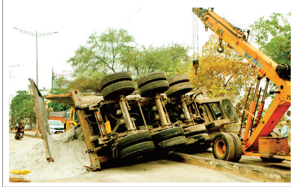
बिलासपुर। ब्रेक फेल होने से अनियंत्रित होकर राखड़ से भरा ट्रैलर सड़क पर पलट गया। सुबह सड़क पर भीड़ नहीं होने से बड़ा हादसा टल गया है। सरकण्डा पुलिस के अनुसार, बुधवार की सुबह 5 बजे होटल डाउन टाउन के पास राखड़ से भरा ट्रैलर कर्माक सीसजी 04 पीजी, 7502 का ब्रेक फेल होने से अनियंत्रित होकर पलट गया। सड़क पर राखड़ फैल जाने से आवागमन बाधित हो गया था। सुबह ट्रैफिक कम होने से बड़ा हादसा होने से टल गया। सूचना मिलते ही पुलिस मौके पर पहुंच गई। जेसीबी की मदद से सड़क में फेले राखड़ को हटाया गया। वहीं केन से ट्रैलर को सड़क किनारे किया गया। उसके बाद आवागमन शुरू हो पाया है। ज्ञात हो कि उस मार्ग में दिन में ट्रैफिक का दबाव अधिक होता है। ऐसे में उक्त ट्रैलर के पलटने पर बड़ा हादसा हो सकता था।